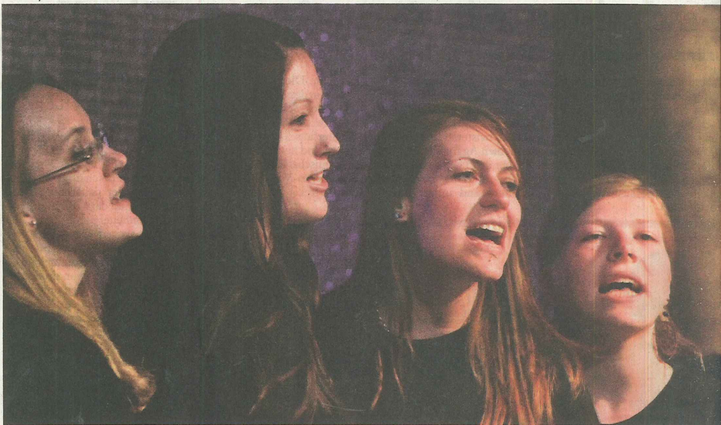
Gelungener Auftritt bei den Designtagen: Coburgs Hochschulchor „Klangfänger“.