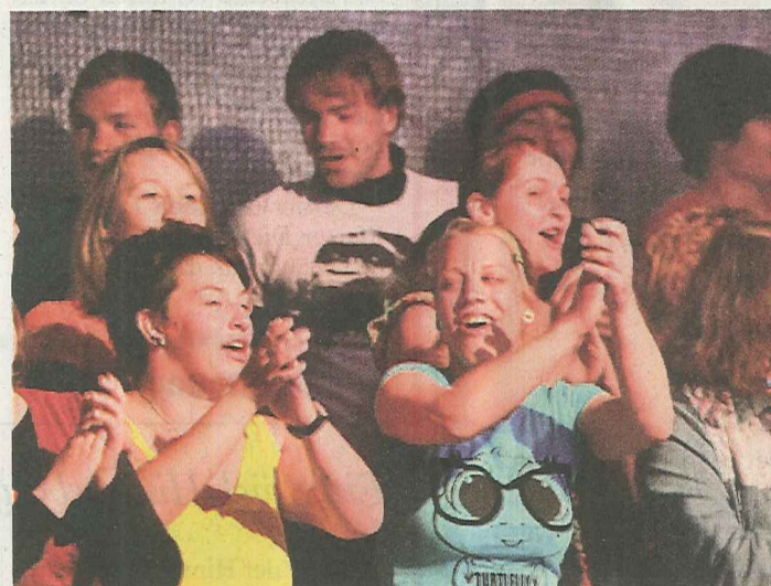
Mitreisender Gesang: die Frauen-...