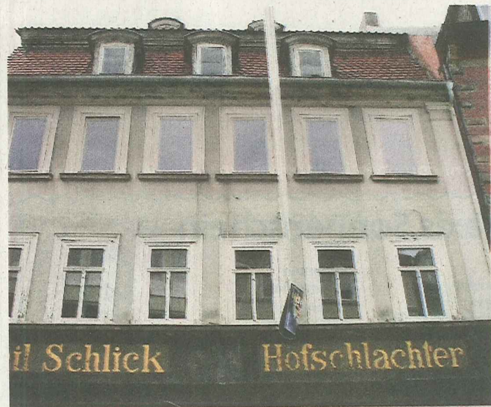
Die Fassade im Steinweg 29 zeigt den Vergleich. Unten historische, oben später eingesetzte Fenster.

Die Altstadtfreunde treffen sich regelmäßig jeweils am vierten Mittwoch im Monat um 19 Uhr im „Münchner Hofbräu“ (Kleine Johannissgasse 8). laf