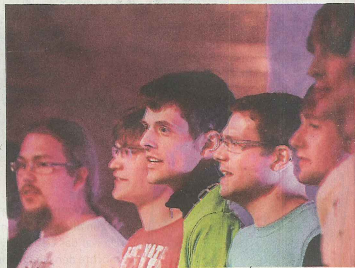
...und Männerstimmen des Coburger Hochschulchors.